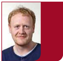
af Thomas Bau

I den svenske fim "Den enfoldige morder", ser man en meget rig og i lokalområdet dominerende fabrikant Høglund, som elsker magt. Hele glæden ved den formue, han har opbygget, består i, at hans position giver ham mulighed for at dominere andre svagere mennesker. En af hans arbejdere, en fattig familiefar skylder ham penge. Arbejderen tigger og beder om at få henstand. Bare til vinteren er ovre. Han kan godt betale nu, men det vil betyde, at hans familie skal sulte vinteren over. Men der er ikke noget at gøre. Han skal betale til tiden. Og en aften går han så op til fabrikanten med pengene, alt, hvad han ejer, og alt hvad han har kunnet pantsætte sig til, er lagt ned i en konvolut. Fabrikanten leger med sit barnebarn, mens han fraværende modtager pengene. Han fortæller, at det jo ikke er pengene, det drejer sig om, dem har han nok af, men det er princippet, som tæller, man skal betale til tiden. Lige i det den fattige mand skal til at forlade lokalet, smider Høglund så hele pengebundet i kaminens flammer. Ydmygelsen er lammende. Det tapper den fattige