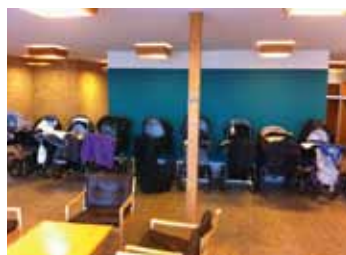
Tomme barnevogne som venter, mens der er babysalmesang i Johanneskirken